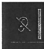
Figura 4 - Simbolo indicativo utenti sordi non registrati

Le informazioni visive consentono all'operatore di avviare l'applicativo 112Sordi e di compilare la scheda contatto con i dati identificazione del chiamante, di localizzazione e di categorizzazione, per la gestione preliminare della chiamata di emergenza. Una volta ricevuta conferma dell'immediato invio del mezzo di soccorso, l'operatore della CUR si pone come intermediario tra l'utente e l'operatore del PSAP 2, nella gestione della chat , interrogando il chiamante con le domande poste dal PSAP 2 e riportando le risposte all'utente, al fine di circostanziare al meglio la necessità di quest'ultimo.